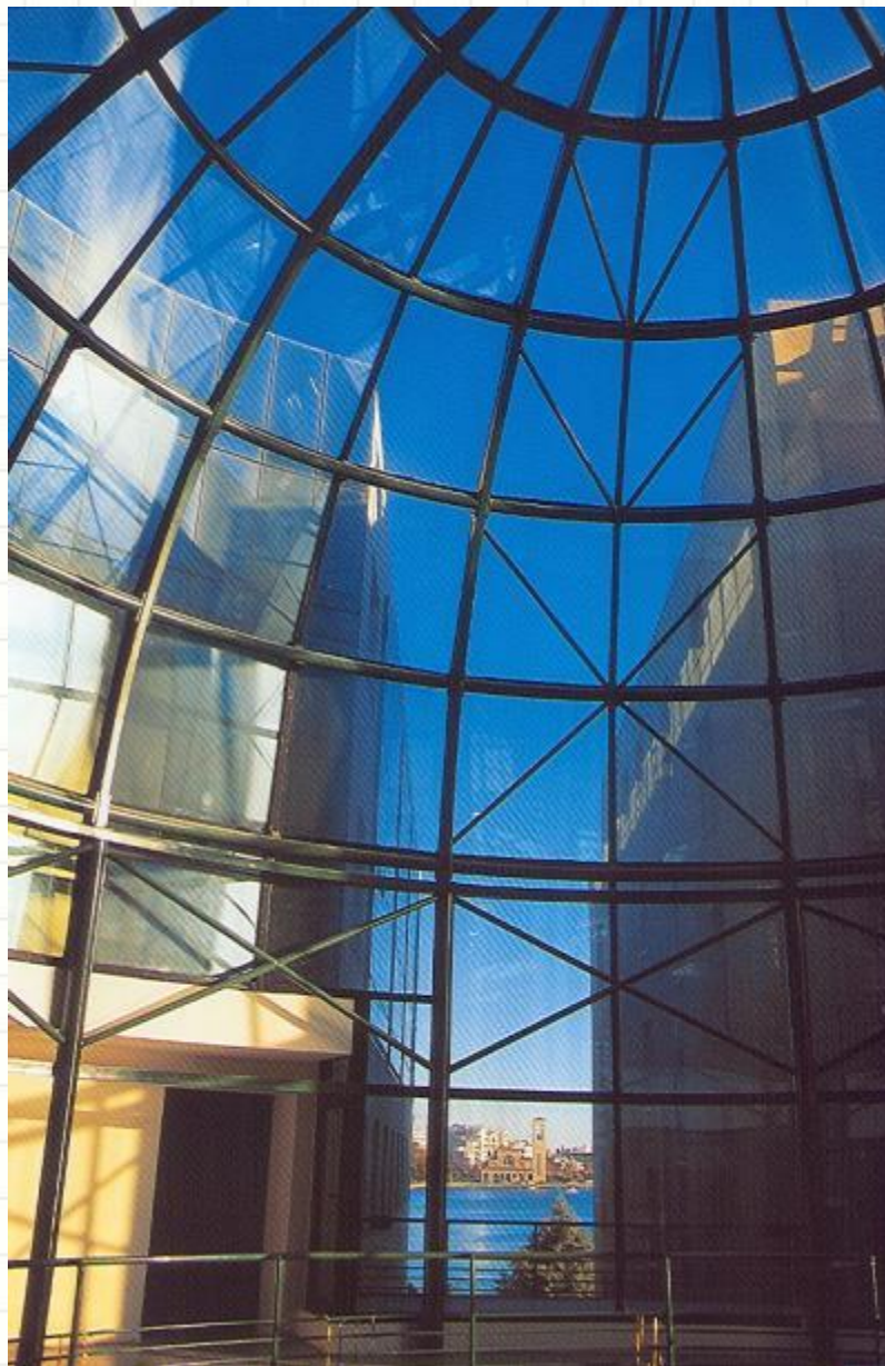
Πανεπιστήμιο – Θόλος